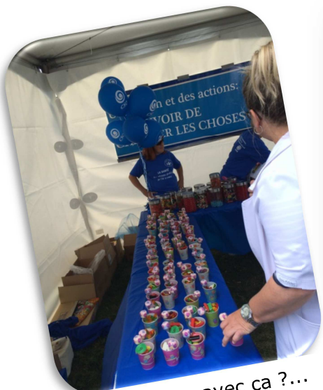
Des bonbons avec ça ?...