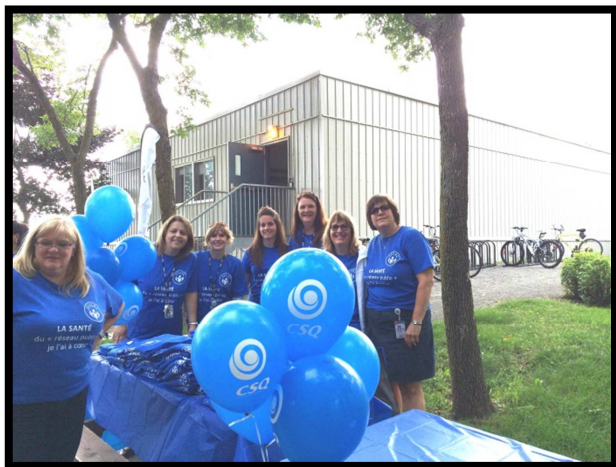
La journée débute à la Cité-de-la-Santé... Une belle équipe gonflée à bloc !!!