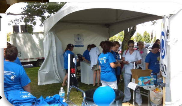
Ça défilait, à la Cité-de-la-Santé...