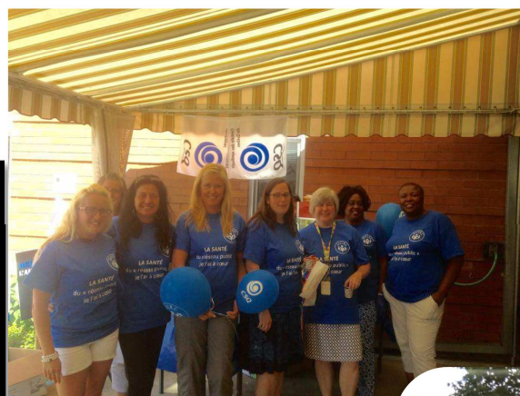
Au CLSC-CHSLD Sainte-Rose, une équipe souriante et dynamique.