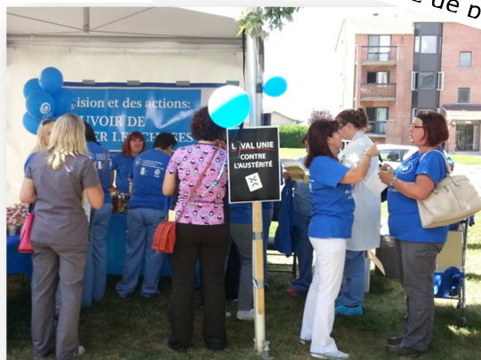
Les membres discutent de quoi, vous pensez ???