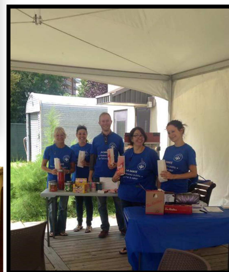
L'équipe du CLSC-CHSLD Idola-Saint-Jean, pimpante comme du pop-corn !!!