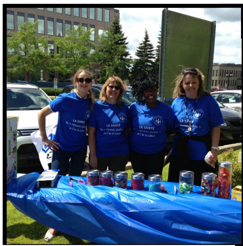
Au CARL aussi, on aime les bonbons.